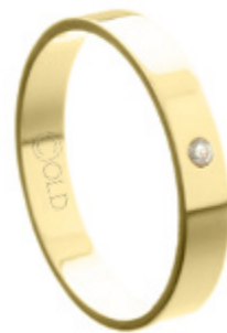
AL-436/C L: 3,4mm A: 1,0mm