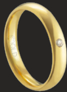
AT-440/C L: 4mm A: 1,8mm