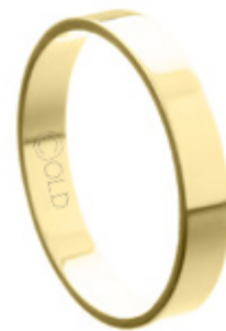
AL-436 L: 3,4mm A: 1,0mm