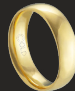
AT-470 L: 7mm A: 2,3mm