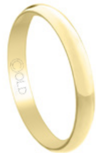
AL-435 L: 3,5mm A: 1,2mm