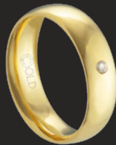
AT-450/C L: 5mm A: 1,8mm