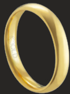
AT-440 L: 4mm A: 1,8mm