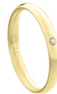
AT-430/C L: 3mm A: 1,6mm