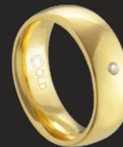
AT-470/C L: 7mm A: 2,3mm