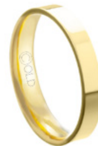
AT-438 L: 3mm A: 1mm