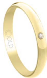
AL-435/C L: 3,5mm A: 1,2mm