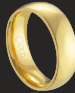
AT-460 L: 6mm A: 1,8mm