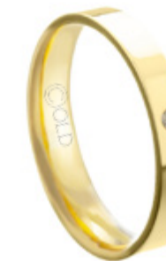
AT-438/C L: 3mm A: 1mm