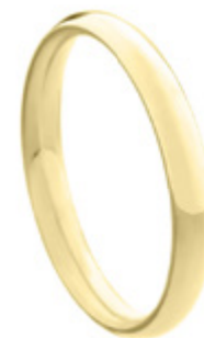
AT-430 L: 3mm A: 1,6mm