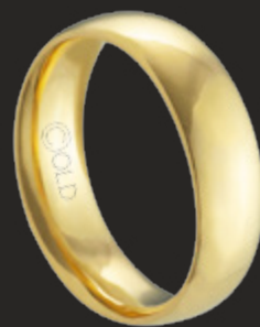
AT-450 L: 5mm A: 1,8mm